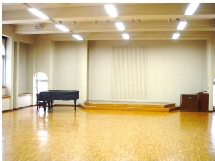
3階 多目的ホール 定員 150名（イスのみ） （机使用時、約70名）