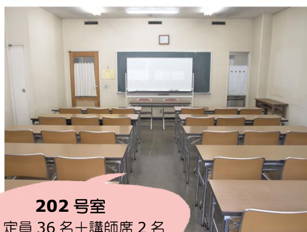
202号室 定員 36名+講師席2名